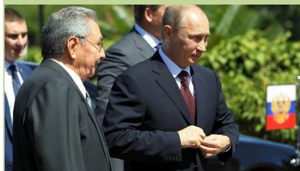
Raúl Castro et Vladimir Poutine

En Juillet 2014, le président russe Vladimir Poutine a visité Cuba dans le cadre de sa tournée en Amérique latine. A cette occasion, il a signé un paquet de 10 accords de coopération dans les domaines de la culture, de l'industrie, du commerce et de la santé, entre autres.