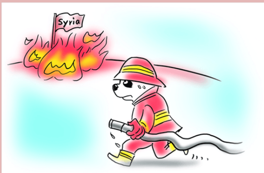
Illustration : Liu Rui/GT

Source : Global Times publiés : 2015-12-27