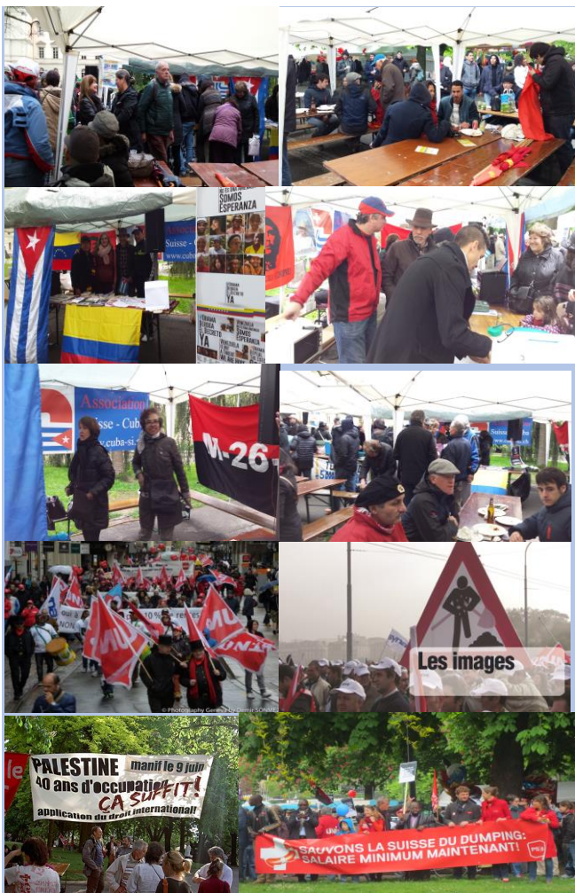
Photos 1 er mai à Berne et Basel